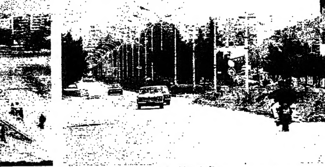
حركة على كورنيش النهر